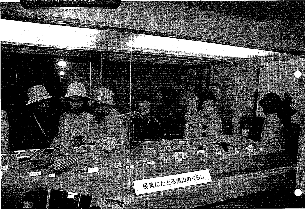
民具にたどる里山のくらし