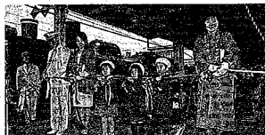
阿賀野路に汽車ふたたび(7日、SL「ばんえつ物語」号出発式)