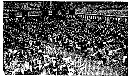
会場では、約九百人もの人々が、熱心に講演に耳を傾けた。