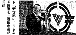
「新世紀へ躍進を誓う」新津市長が式辞