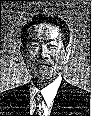
新年あけましておめでとうとご さいます。

本市は、二十一世紀の幕 開けとなる一月一日で市制 施行五十周年を迎えました。 新世紀を明るく夢にあふ れたものとすると、子 どもやお年寄り、女性など 一人ひとりの人権が尊重され る社会の実現と、自然と共 生し環境にやさしい循環型 の社会への転換、さまざま な分野で大きな力となるボ ランティア活動の支援など に力を注いでいかなければ ならないと考えております。