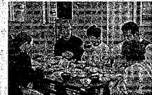
◀ワークショップ「料理で学ぶ思いやり～幸せは健康から～」では、栄養満点のおいしい食卓を囲んで話はずんだ。