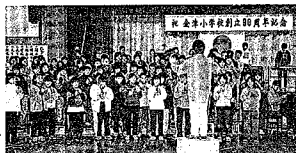
金津小学校創立90周年記念式典・音楽発表会(11月18日)