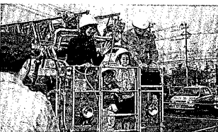
会場の一隅で行われた「はしご車」体験。笑って手を振っていただけるのも今のうち？