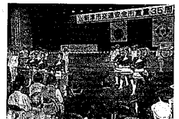
「息が合う」とはまさにこのこと！