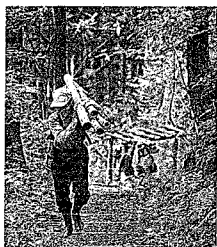
炭焼き窯まで15分、みんなで手分けして竹を運び上げた。