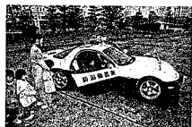
スマートな高速道路用パトカーも順番待ち状態。