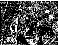
子どもたちの手で炭焼き窯に点火！ テレビの取材も行われた。