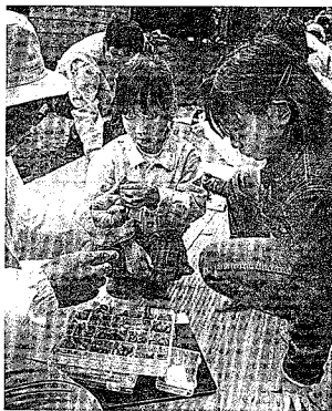
「木の実にこんなに種類があるのね」森そのものが教室であり、先生でもある。

十月十四日、新津丘陵の「ふれあいと交流の森」で親林プログラム2000が行われました。この日は「森づくり」として、昨年植樹した木の周りなどの下草刈りをして森の中の環境を整えたほか、新潟県科大学移動用地とな