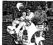
白バイの華麗な演技後はファンサービス。