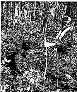
大切な下草刈り。適度に人の手が入ることによって森は元気になる。