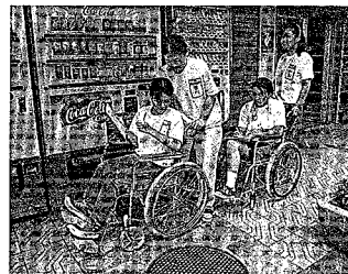
▲車椅子の補助も力があるよ。気をつけて!