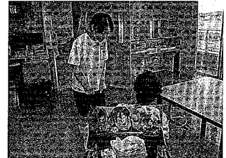
▲最初は、そわそわ…。でも、がんばるぞ!