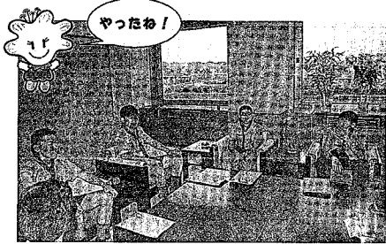
▲日本の食事はおいしい、アニメもおもしろいです。