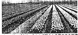
チューリップのじゅうたんに彩られる花のまち新津

編集・発行 / 新潟県新津市 ☎956-8601 新津市程島2009番地 ☎0250-24-2111(代)