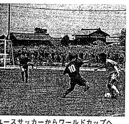
ユースサッカーからワールドカップへ

やさまざまな文化活動に見られる 市民の皆さんの学ぶ意欲には敬服 させられるものがあります。そし て、こうした学習過程における交 流と形づくられるネットワーク は、まろづくりに進めるための大 きな推進力となるものでありま す。生涯学習を通じてまろづく るの力を蓄積しながら、地域の環 境、福祉、教育といった課題につ いても、学び、解決に向け実践し ていく機運を高めてまいりたいと 考えております。