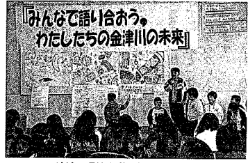
地域や環境を学ぶ総合的な学習

いじめや不登校、また生命の尊 厳に対する意識の欠如など社会的 にも大きな問題となっておりま す。この多くは、子どもたちが自分 以外の人と一緒に築き上げていく 関係が不足していることが大きな 要因となっているような気がいた します。友達や社会や自然といた かりと向き合うことで、自分自身