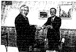
11月8日、社会福祉事業に役立てて、北本建設㈱から5000万円の寄付がありました。