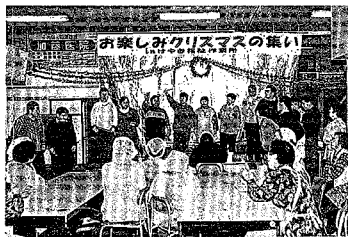
お楽しみクリスマス集い