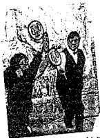
ボランティアの熱演がさらに盛り上げた。