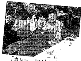
「カレー、おいしいよ!!」

同じく昨年の十二月十三日、けやき福祉作業所でもっと早い「お楽しみクリスマス集い」が開かれました。 この日は、新津市赤十字奉仕団のみさんが作ってくれたカレーライスに舌鼓を打ったあと、作業所の皆さんで結成された「けやき's」が練習に練習を重ねた歌声を披露しました。みんなの熱演には、惜しみない拍手が送られました。