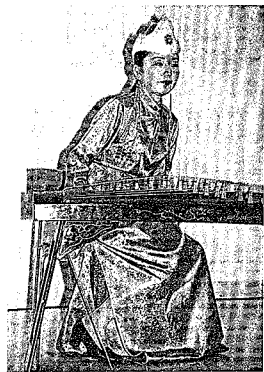
21本の弦から強く深い音色が奏でられた。