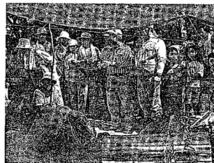
6月2日「炭焼き師入門」 森で伐採した樹木を使い、53名の参加者が手作り窯で炭焼き体験をしました。