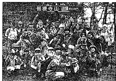
10月3日 菩提樹山山頂で「森の交流会」