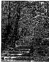
木もれ陽の遊歩道

身近な里山自然であるにいつ丘陵をより豊かにして、未来の新津を担う子どもたちに引き継ぐことが、大人である私たちの責任ではないでしょうか。