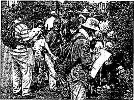
「まずは、森を知らなくちゃ」 (7月10日の自然観察会)

また、里山が荒廃して身の回りから木や緑が少なくなることで、人間が持つ心の潤いが不足する傾向があるとも言われています。古来から人間とともに生きてきた里山を今、守り育むことが求められているのです。