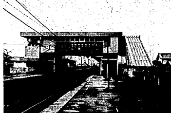
下り線ホームから見た荻川駅(右側が西口)