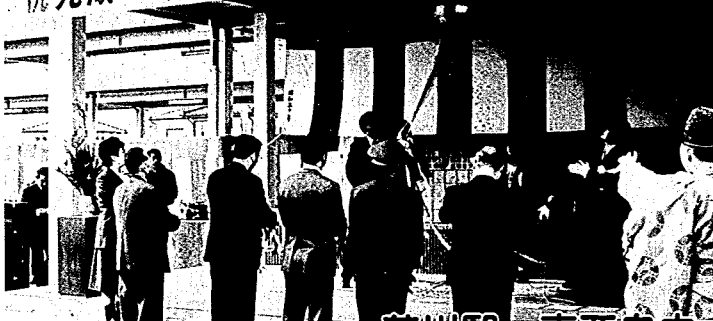
テープカットとくす玉開披で完成を祝いました