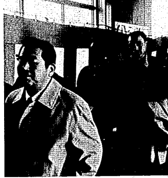
式典参列者全員で嬉しい渡り初め