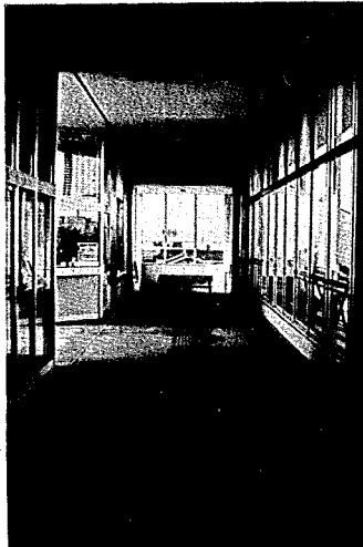
幅2.7mで荻川駅の東西を結ぶ自由通路

自由通路は、鉄骨コンクリート造りで、橋上で東西を結んでいます。幅員は、階段部分が3.2m、通路部分が2.7mで、通路延長は55mほどあり、橋上には駅舎が併設されているモダンな施設です。駅を利用するときや、また、いつでも自由に通れるということで、地元の皆さんに大変喜ばれています。