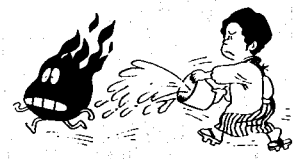
日ごろから防火への備えを

置き場所は... カーテンやふすまなど燃えやすいもののそばや、上から物が落ちるかもしれないなどの注意が必要です。 人の出入口や通路などには転倒の危険があるので避ける 移動させる場合は、いったん火を消す。