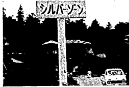
この標識を見たら徐行を