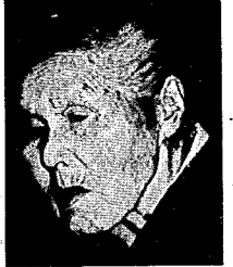
103歳を迎えた杵淵さん