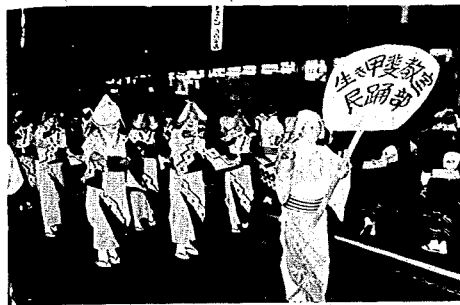
今年の民謡流しには「生きがい教室」のみなさんも参加

この相談所は、市役所商工観光課内にあり、月曜から土曜まで毎日開設しています。お気軽に求職、求人の相談においでください。