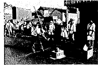
今年の歩行者天国は8日の昼と夜に