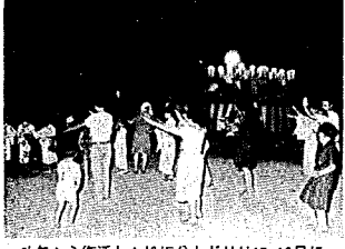
昨年から復活した松坂盆おどりは15・16日に

松坂流しは十七日夜に、屋台たるみこし祭は十九日、二十日に開かれます。 夏まつりの主役は、言うまでもなく市民一人一人、つまりあなたです。みんなで見て、参加して大いに盛り上げたいものです。 あなたもまつりの輪の中に飛び込んで、夏のひとときを楽しませませんか。