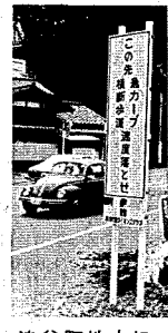
北上地内などで新たな交通規制

七月一日から上の図の場所で新規の交通規制が実施されました。要点は次のとおりです。 ①②③④⑤⑥ 最高速度三〇km、駐車禁止 ⑦ 最高速度二〇km、駐車禁止 ⑧ 自動車、原付通行止め また関根医院・山先交差点(本町四)