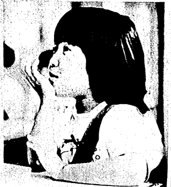
こどもたちに平和な未来を