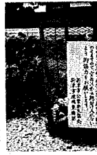
滝谷町地内の空き缶回収かご