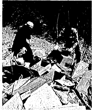
以前より減ったものの不法投棄がまだ見られます。最近では家庭から出されるゴミが目立って増えてきました。(写真は、金津地内の不法投棄のゴミの山)

会と新津生活学校のみなさんと関係機関、あわせて二十人ほどの人が参加しました。空き缶などの回収作業は、市内を通る四つの県道と、それに接続する市道の約二十kmにわたって行われ、手にはたばこケース、袋もたたまらばいい感じになるほど空き缶が見つかりました。