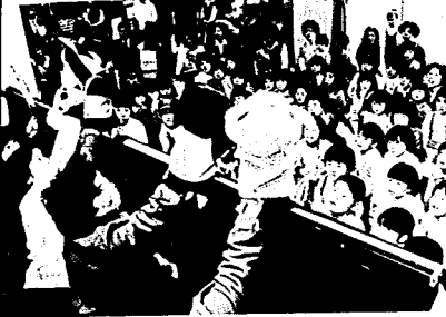
指人形劇にじっと見入るチビッ子たち