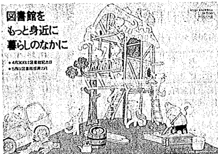
「図書館振興の月」ポスター(「1日びきのねことぶた」より)