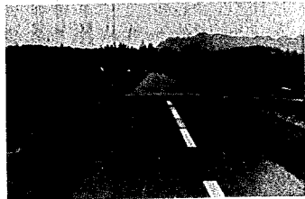
程島農道の拡幅は今年度で完成します