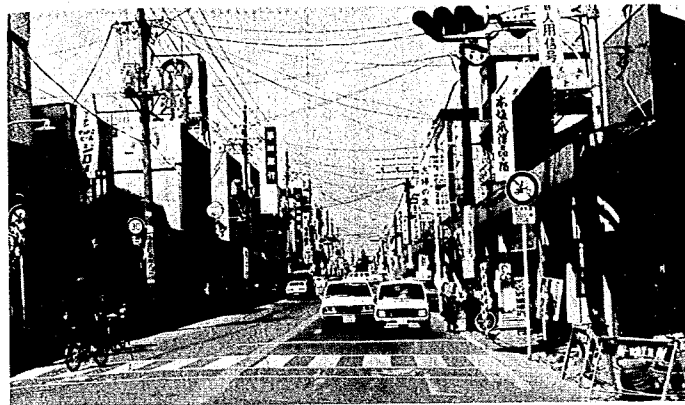
商業環境の変化に対応していくため商業近代化地域計画策定事業に助成します