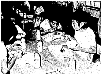
米飯給食は今年から週2回を予定