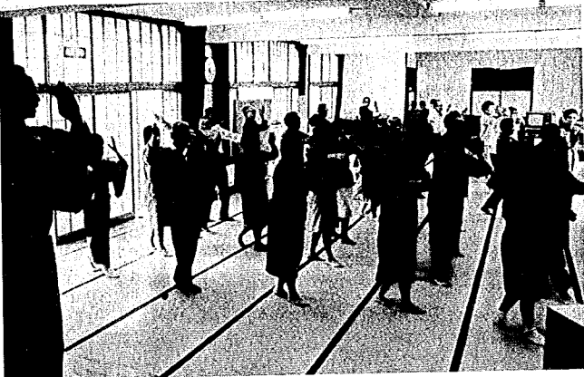
生きがい、—それは心の健康にとっても大切です