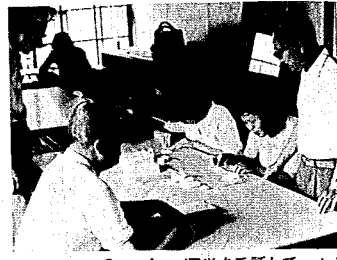
「山の家」は「親の会」へ運営を委託しています