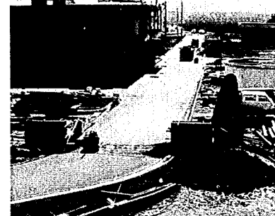
浄水場の構内整備が始まりました