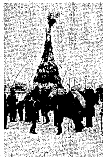
高くそびえる塞の神

小正月には、各地で「塞の神」行事が開かれましたが、ここ金沢町一丁目でもにぎやかにこの伝統行事がおこなわれました。 これは、地域の伝統行事を子どもたちにも知ってもらうと、PTAと町内会で数年前から始めたもので