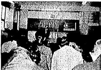
金津小で開かれた結成総会

本好きな人で毎回いっぴいの「読書 会」ですが、先月18日には今年初めて の会が開かれ1年の「読書計画」など を話し合いました。和気あいあいム ードの中にも熱心に話し合う姿勢は読書 に意欲まんまんといったところです。