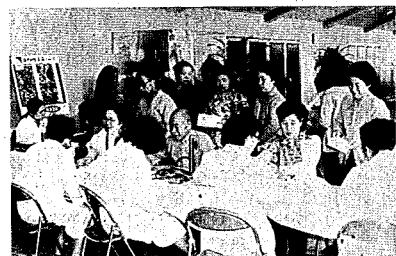
自分の血圧を知って健康管理のめやすに

大切な日常の血圧管理 だれでもできる、そして一番大切な成人病の予防は、血圧の管理です。 そのためには、まず自分の血圧を知らなくてはなりません。健康診断の時に、血