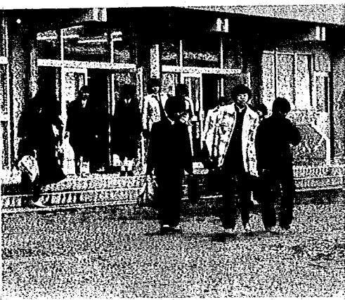
若者たちの地元志向が強まっています

東京や大阪などから新津へ帰省している方も多しと思 います。ふるさとのお正月をいかにお過ごしでしょうか。 ところで、「Uターン現象」という言葉もすっかり耳に なじみきました。これは、いったん地方から大都市へ就職、 または学校へ行った人が、生まれふるさとへもどってく ることをいいますが、最近、目立って増えているようです。 また、ある調査では、大都市より地方の中小都市の方 が住みよい、という結果も出ており、地方見直しの時代 が始まったようです。