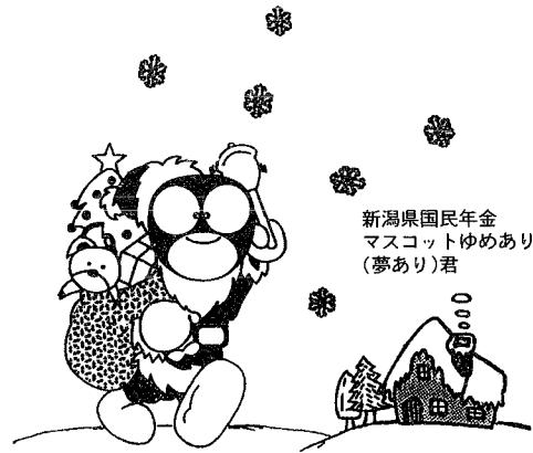
新潟県国民年金 マスコットゆめあり (夢あり君)

みなさん、国民年金保険料の納め忘れはありませんか？ 納め忘れがあると、老後の支えとなる老齢基礎年金が減額されたり、もしもときの障害基礎年金や遺族基礎年金が受けられない場合があります。 このようなことがないように、国民年金保険料の納付は便利で確実な口座振替をお勧めします。毎月の納める手間を省くだけでなく、うっかり納め忘れてしまう心配もなくなります。 国民年金保険料の納付には、ぜひ口座振替をご利用ください。 口座振替の手続きは、通帳・銀行届出印をお持ちの上、金融機関又は社会保険事務所で。