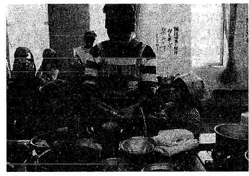
今回作った献立のレシピは役場保健福祉課(五番窓口)にあります。

十月四日(土)に行われた食推協議会主催の親子クッキング、当日の献立です。親子で二十四名の参加でした。おばあさんの参加もあり、楽しい時間が過ぎました。材料を切ったり、つぶしたり丸めたり。味噌汁は削り節のだしを作り、塩分が6gに抑えられました。油の少ないコロッケも好評でした。