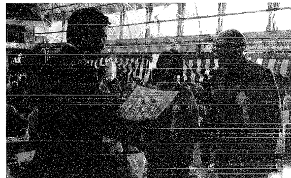
金婚おめでとうございます