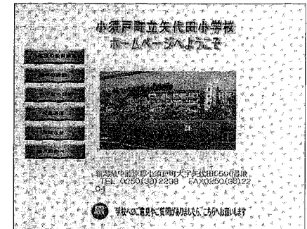
矢代田小学校 トップページ