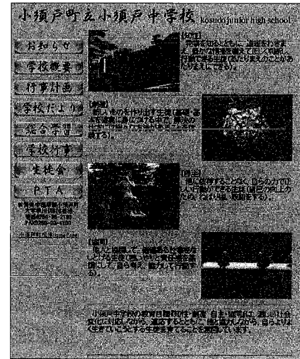
小須戸中学校 トップページ