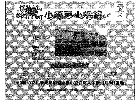
小須戸小学校 トップページ