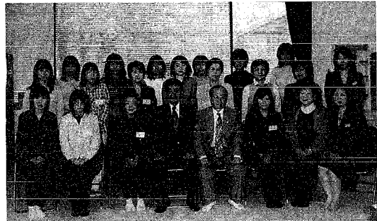
母子保健推進員の皆さんです

5月1日に母子保健推進員(通称:母推)の委嘱状が交付されました。母推さんは、お母さん方の身近な相談窓口や行政と住民の皆さんとのパイプ役として活躍されます。 今年度からH18年度までの3年間、務めていただく母推さんを紹介します。