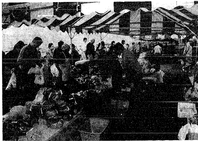
野菜・果物がとっても新鮮