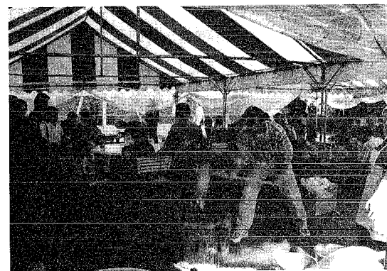
つきたてのお餅はおいしいよ