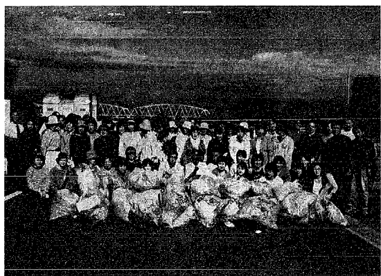
親水緑地公園をきれいにしていただきました。

中央公民館の避難訓練 中央公民館では、去る9月26日(水)午後二時より避難訓練を実施しました。 火災発生と同時に119番通報や避難階段を使った避難を行いました。又、普段使い慣れてない消火器の体験などを行うなど、防災意識の向上を図りました。