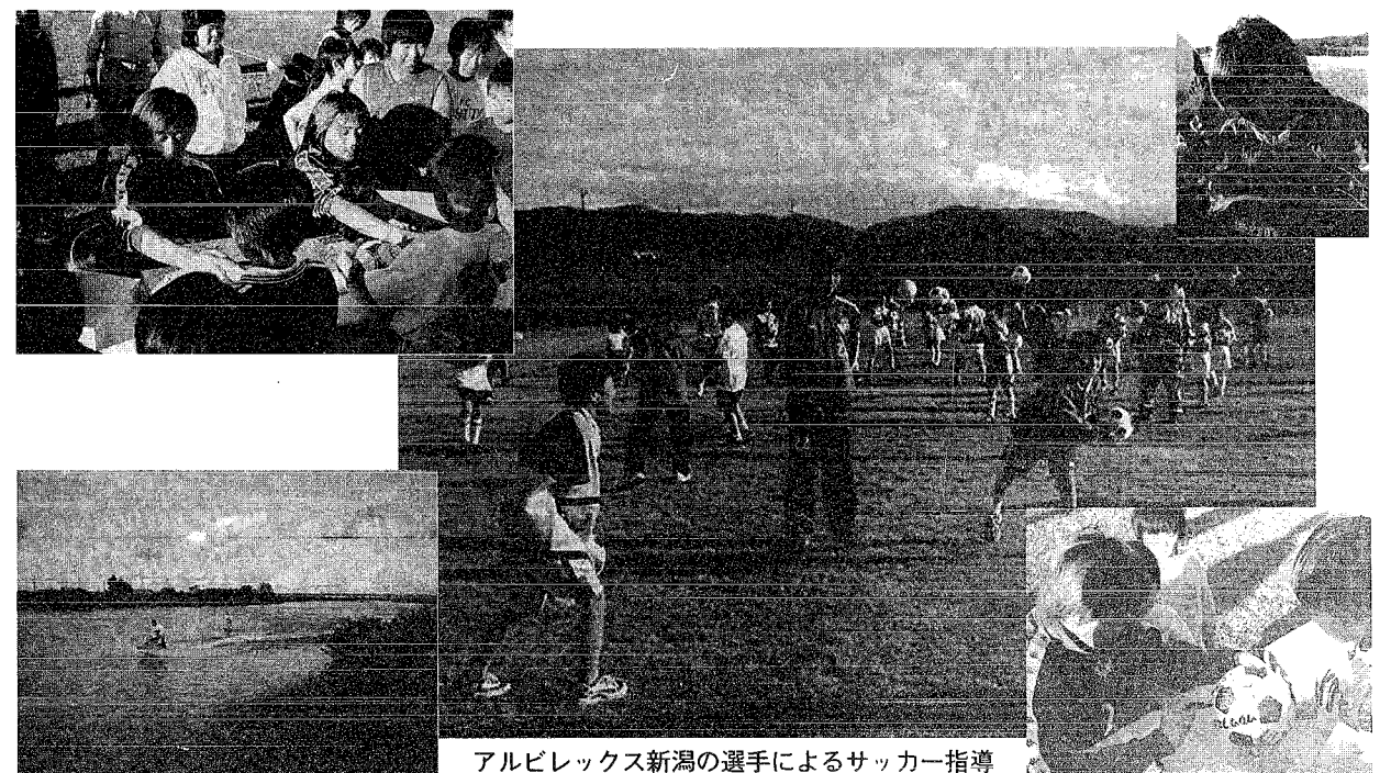
アルビレックス新潟の選手によるサッカー指導