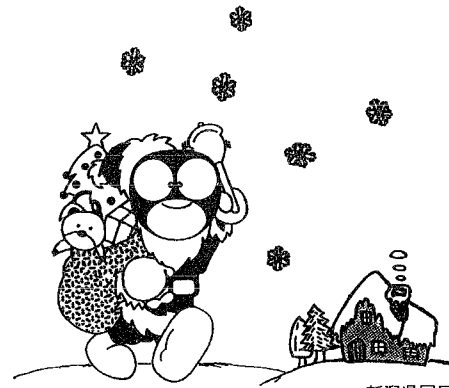
新潟県国民年金 マスコットゆめあり (夢あり)君