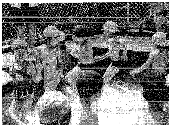
水遊びをたのしく過ごすため、保護者の方は危ないとおもったらすぐに子どもに注意してください。

夏一番を迎えて海へ海水浴に出かける機会も多いとおもいますが泳ぐ前には必ず準備運動をさせ、目の届く場所で遊ばせるようにしてください。また、悪天候のときや波が高いときは決して泳がせないようにしてください。