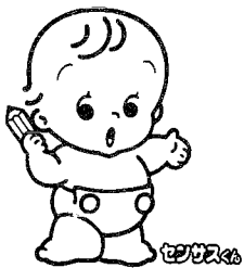
国勢調査イメージ・キャラクター

今年、国勢調査が行われます。日本に住んでいるすべての人が対象です。来る21世紀に欠くことのできない統計を提供します。この調査の実施をあなたの作ったポスターでかけましょう。