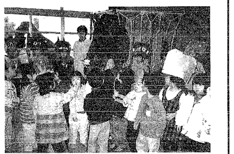
みんな大鬼と握手? ほんとに鬼は逃げていったかな?

毎年恒例の豆まきが2月3日の節分に行われました。自分のつくった鬼のお面をつけ鬼は外!福は内!!こりゃたまらんとみんなの中の鬼は逃げていったことでしょう。