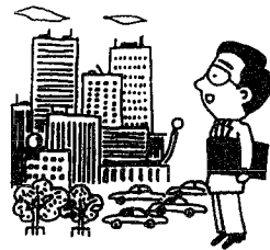
一産業と暮らしに活かす サービス業基本調査 総務庁統計局 新潟県 市町村

全国で約35万の事業所が統計的手法によって選ばれます。 調査にご協力をお願いします。