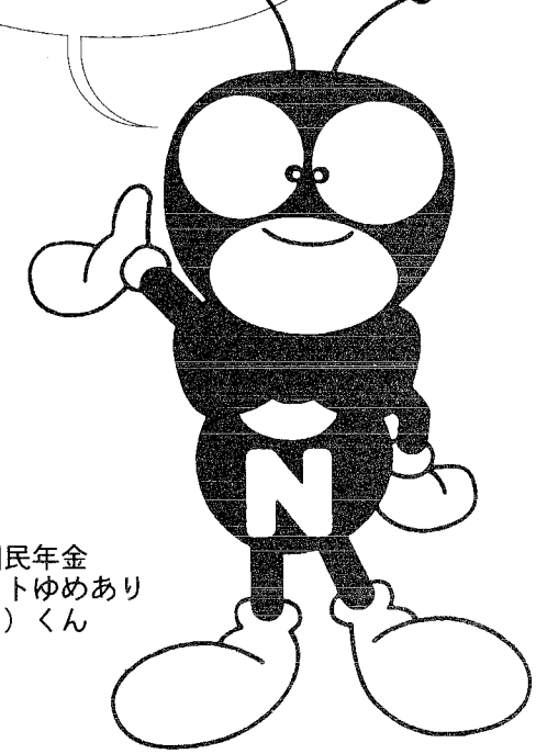
新潟県国民年金 マスコットゆめあり (夢あり)くん

国民年金は、あなたや家族を支えるために国が運営する、安心できる社会保険制度です。