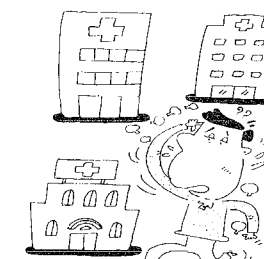
(はしご受診はやめましょう)

※外来の薬剤にかかる一部負担については、国民健康保険、退職者医療制度、老人保険制度の各制度、同じです。