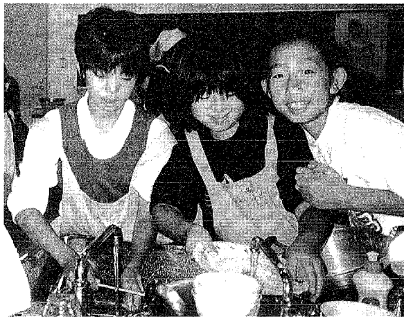
楽しかった「子どもクッキング」