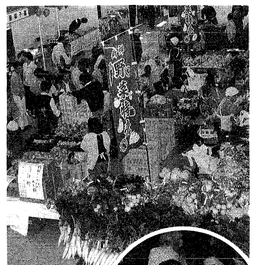
◀新鮮で安いと毎年大好評の野菜特売