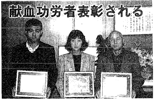
献血功労者表彰される