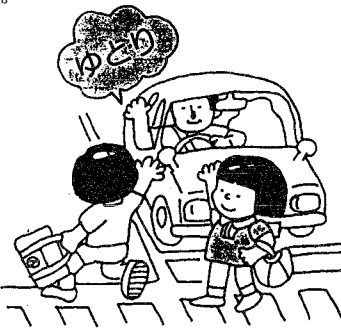
ゆとりあふ 心のゆとり 思いやり